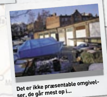
Det er ikke præsentable omgivelser, de går mest op i...