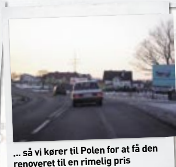
... så vi kører til Polen for at få den renoveret til en rimelig pris