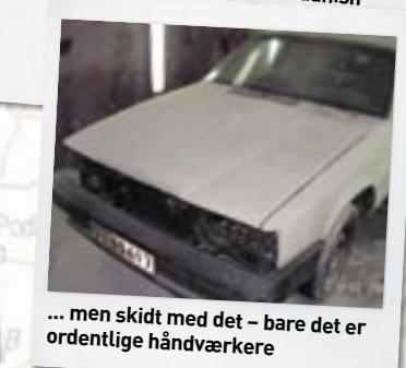
... men skidt med det – bare det er ordentlige håndværkere