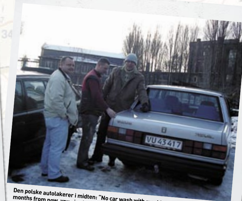
Den polske autolakerer i midten: "No car wash with machine. Only by hand. And six months from now, you give her wax. And then polish" Polish? No I'm danish