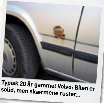
Typisk 20 år gammel Volvo: Bilen er solid, men skærmene rustar...