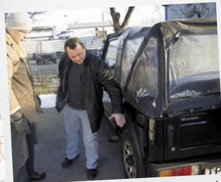
Dansk Suzuki SJ40 er ved at få den store tur: Nye skærme og skærmkasser (var rustet væk), diverse reparationer, ny læderkabine og farveskift til sort. Afventer nu ny kaleche (billigere end at lave den i hånden). Totalpris: ca. 30.000 kr.

Udenfor holder en hvid London-taxi med "Købstædernes Forsikring"-skilt på siden, en Opel Rekord fra 1979, en Morris 1000 Bindingsværk, der burde sænkes i havnen, men skal totalrenoveres, fordi ejeren insisterer