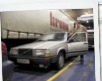
Bilfærgen Gedser-Rostock er hurtigste vej fra Sjælland til Polen