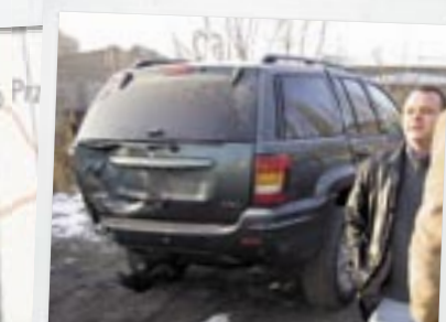
Totalskaded nyere Jeep Cherokee, er slået 2,5 cm skævt – men kan reddes

har altså brugt fire timer på at køre 300 km forgæves og ved du, hvad der så sker, Holger? Det bliver sagt. Så nu ved Bil Magasinet 336.000 læsere det.