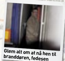
Glem alt om at nå hen til branddøren, fedesen

Pointe: Hvis det brænder eller lortet synker, så bed til, at det ikke sker, mens du opholder dig på det her dæk.