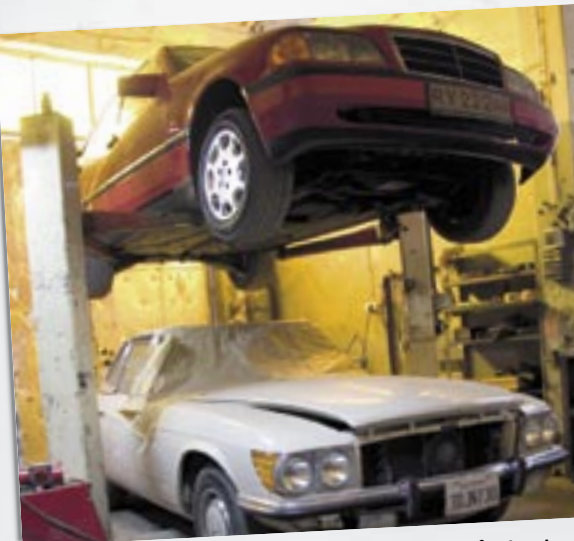
Øverst en C-klasse fra Vejle, der er nylakeret og har fået lavet rust og undervognsbeskyttelse. Ligner en ny bil. Nederst en 450 SLC på californiske plader med de karakteristiske USA-forlygter