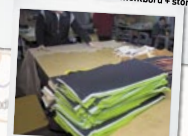
Saddelmager: Al slags indtræk eftermonteres og ombetrækkes