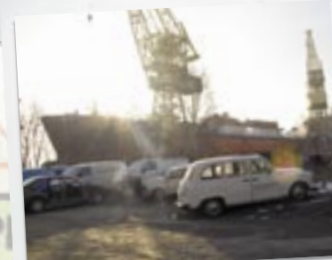
I baggrunden en norsk supertanker, der også skal renoveres

det centrale Polen Holger er kørt. Han havde en aftale 80 km herfra og er først tilbage senere, siger en kvinde med polsk accent. Vi