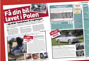
Bil Magasinet oktober 2005

DET BILLIGT En værkstedstid koster langt under det halve af i Danmark. DET HAR JEG HØRT FØR Ja, i oktober 2005 skrev vi om to danskere, der havde fået sat en MG og en Amazon i stand. Siden har telefonen ikke stået stille; læserne vil vide mere. HVAD SÅ NU? Nu sender vi vores egen mand og hans bil derned og ser, hvad der sker. KONKLUSIONEN? Den får du næste måned, når vi henter bilen igen.