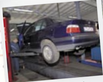
Bosch-værkstedet foretrækker BMW, men tager imod alle mærker