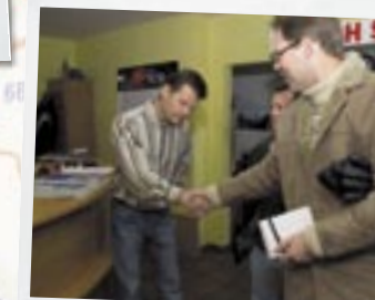
"Ufatteligt, hvad de kommer slæbende med af gammel lort, de danskere"