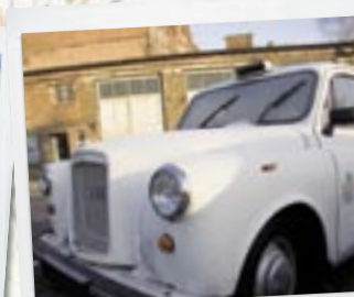
Hvid danskejet London-taxi venter på rustarbejde og lakering