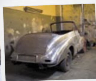
Sunbeam Roadster årg. 1952 – langtidsprojekt på ca. et halvt år