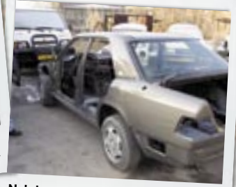
Nylakeret E-klasse med rustarbejde udført, klar til montering

(vi finder dele fra danske huggere og sætter på den, for den er alligevel FOR dårlig, lyder det) og et skelet af en ny-malet Mercedes E-klasse med nylavede svejsninger i bunden ("der VAR ingen bund, så vi lavede én").