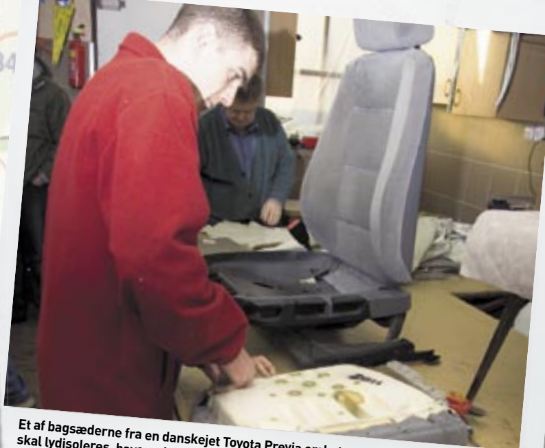
Et af bagsæderne fra en danskejet Toyota Previa ombetrækkes med læder. Hele bilen skal lydisoleres, have ny læderkabine inkl. døre, armlæn og instrumentbord + stort hi-fi inkl. dvd, totalpris: ca. 60.000 kr.