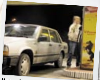
Nogen Lupo treliter er der ikke tale om. Første 350 km = 8,1 km/l